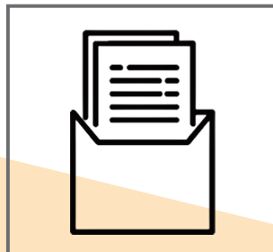
応募書類の作り方